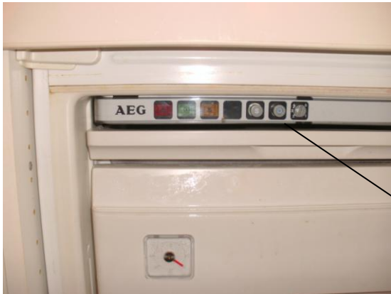
in het midden indrukken met een potlood om aan te zetten

Om de diepvries aan te zetten moet de middelste knop in het midden met een potlood of balpen ingedrukt worden.